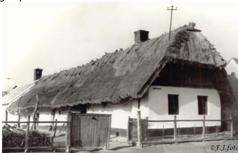
Az utolsó hosszú udvar Felsőporon.

örök összeírásában, ott 37 főből, 24 fő kisipari tevékenységet is folytat, ez nagyon magas arány a többi községhez képest. 1848-ban a nemeskéri csizmadia céhnek 18 felszopori tagja volt. Vannak családok, melynek több tagja is végez kisipari tevékenységet, sokszor apáról fiúra száll a mesterség folytatása.