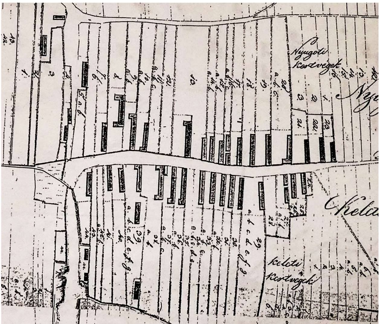
Alszipor térképe 1843-ból.

költöztek és jelenleg 5 házban lakik olyan, akinek felmenői között sem volt magyar. Szerencsére mikor már vészesen kezdett fogyni a lakosság, és szinte teljes elnéptelenedés fenyegette a falurészt, egyéb intézkedések miatt, sok magyar állampolgár vásárolt házat. Nagyobb részt fiatal családok. A 2020-as évre már szinte nem maradt üres ház. Jelenleg 5 házban nem laknak, de nagyobb része felújítás alatt áll, csak idő kérdése, az új tulajdonos mikor veszi igénybe. Jelenleg 47 ház található, abból 21-nek olyan a tulajdonosa, aki 1980-ban ő, vagy felmenője itt lakott, ezek 17 család leszármazottai. Jelenleg 18 ház tulajdonosa olyan, aki 1960-ban ő, vagy felmenője itt lakott, ezek 14 család leszármazottai. Jelenleg 18 ház tulajdonosa olyan, aki 1940-ben ő, vagy felmenője itt lakott, ezek 14 család leszármazottai. 1857-ben 6 olyan nevet találni, ami a mai nap is megtalálható. Ezek a nevek: Csuka, Giczy, Horváth, Huszár, Farkas és Szopory. 1848-ban 4 név található, ami most is megtalálható: Horváth, Huszár, Farkas és Szopory.